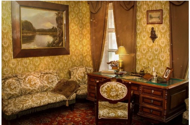
В музее Мамина-Сибиряка в Екатеринбурге