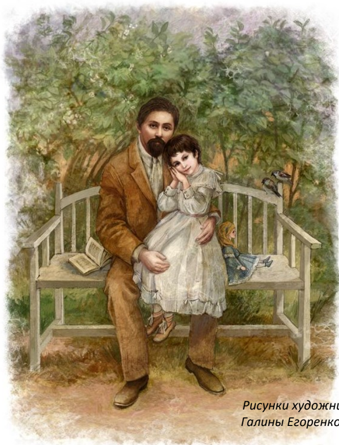
Рисунки художницы Галины Егоренковой